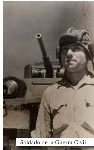
Soldado de la Guerra Civil

Durante casi tres largos años, se enfrentaron en innumerables batallas ambos bandos, en diferentes frentes: el “bando republicano”, constituido en torno al Gobierno vigente, y el “bando sublevado”, o “bando nacional”, organizado por parte del alto mando militar de aquella época. Fue tal la magnitud del conflicto bélico que se calcula que la cifra de fallecidos, de manera directa o indirecta, pudo ascender a más de medio millón de personas.