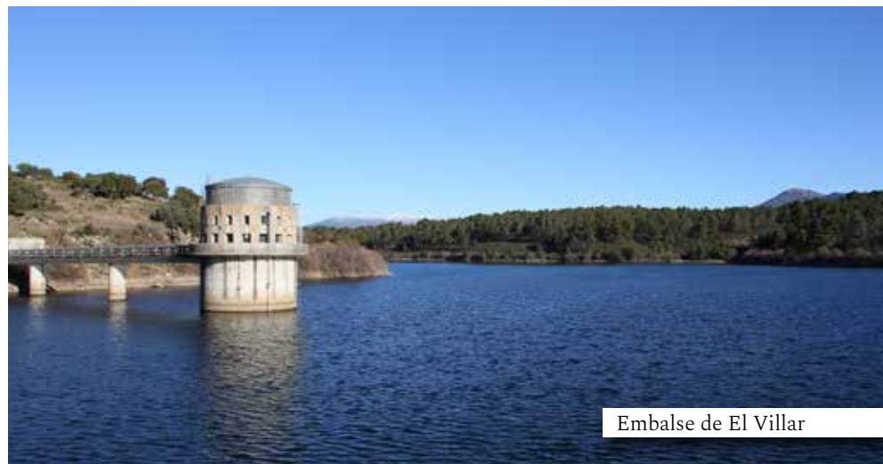
Embalse de El Villar

Tras ser retenidas en Buitrago, las tropas sublevadas, se dirigieron y ocuparon Paredes de Buitrago y las alturas próximas, para intentar hacerse con el control de ambos embalses. Comenzó entonces la lucha para proteger el suministro de agua, iniciándose la construcción de las primeras trincheras, parapetos y refugios, que más adelante se vieron reforzados por ambos bandos con nidos de ametralladoras, refugios subterráneos y puestos de mando, creándose un gran entramado defensivo militar.