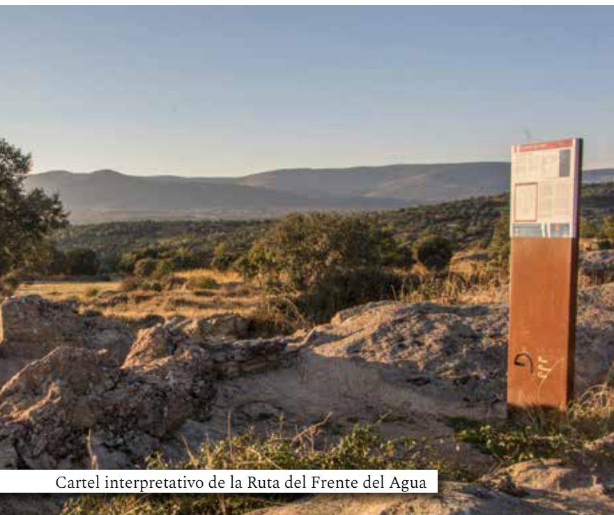
Cartel interpretativo de la Ruta del Frente del Agua

Gracias a la puesta en valor de nuestro patrimonio, hoy podemos conocer y descubrir uno de los mejores ejemplos de fortificaciones defensivas de la Guerra Civil, de ambos bandos, tanto del frente republicano como del ejército franquista.