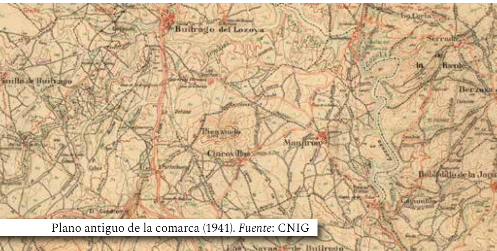
Plano antiguo de la comarca (1941).

En fechas más recientes, en 1976, tuvo lugar la unión e integración de los cuatro núcleos urbanos, dando lugar al municipio de Puentes Viejas, a partir de un Decreto Ley (del 24 de julio de 1975). Cada núcleo que conforma el municipio mantuvo su denominación de antaño, estableciéndose como la sede municipal en el pueblo de Mangirón.