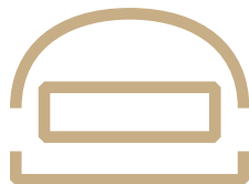
Fortificación del Frente del Agua

Los planes de Mola, uno de los artífices del golpe de estado que desencadenó la Guerra Civil, se paralizaron por falta de fuerzas, escasez de municiones y por la seria resistencia planteada por parte de las milicias republicanas.