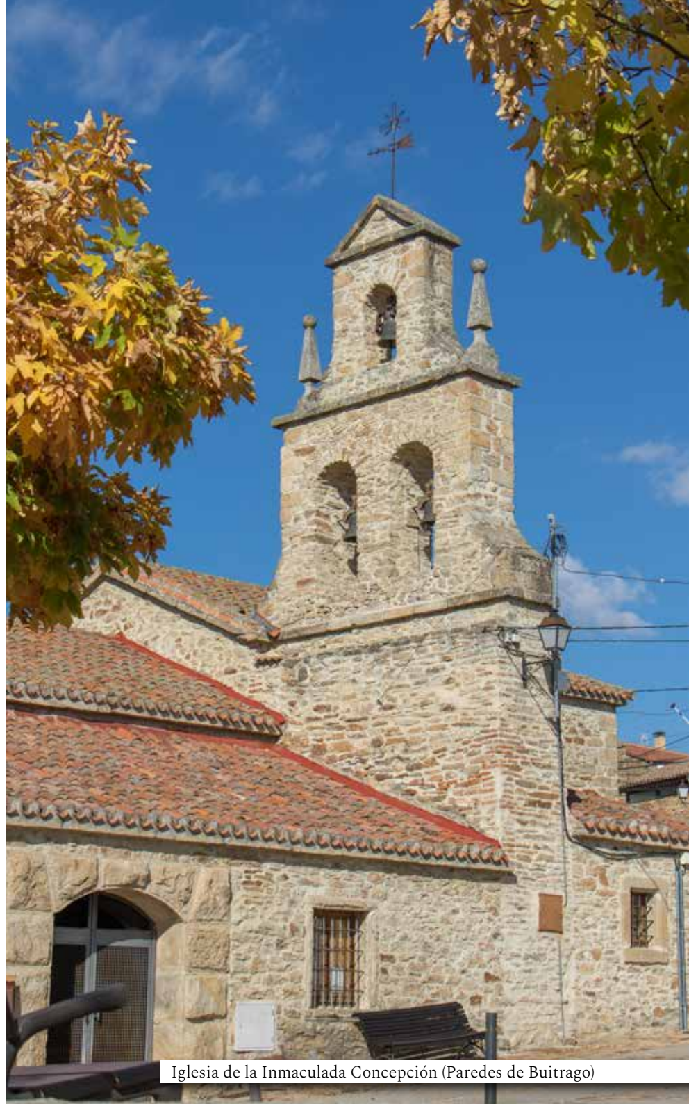
Iglesia de la Inmaculada Concepción (Paredes de Buitrago)