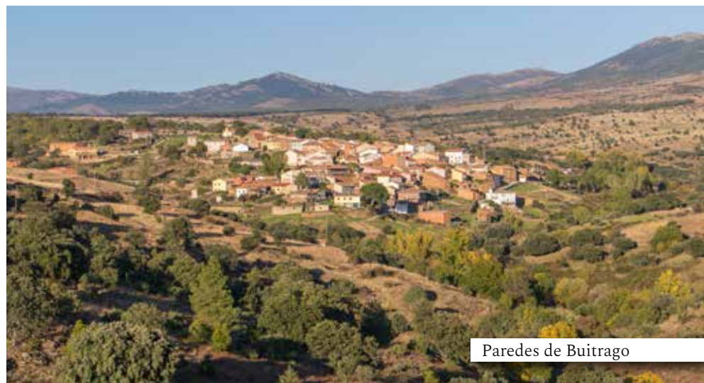
Paredes de Buitrago

Mención especial merece la Ruta del Frente del Agua, un sorprendente recorrido histórico en plena naturaleza, señalado con paneles explicativos, en el que podrás contemplar diversas fortificaciones de la Guerra Civil, muy bien conservadas. Por su importancia y por su interés, está incluido en el Plan de Yacimientos visitables de la Comunidad de Madrid.