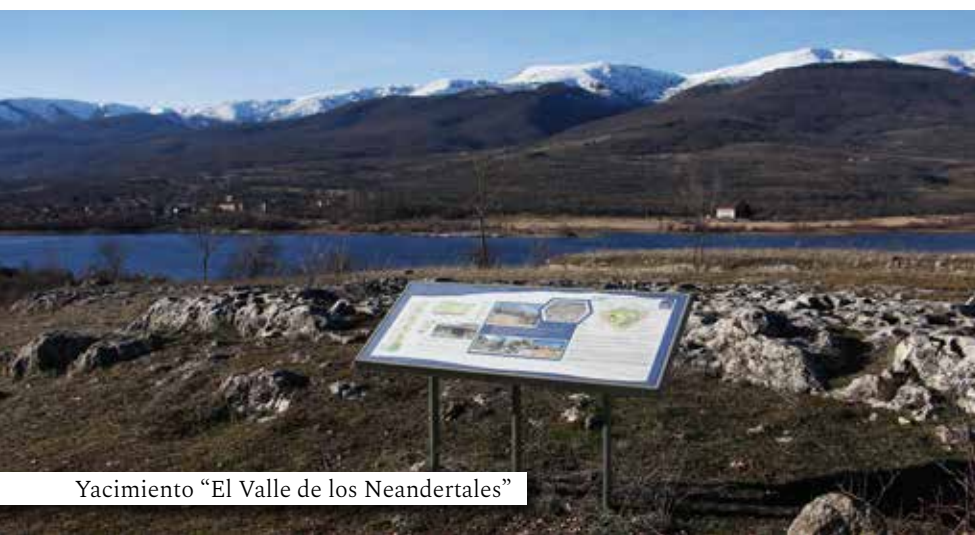
Yacimiento “El Valle de los Neandertales”