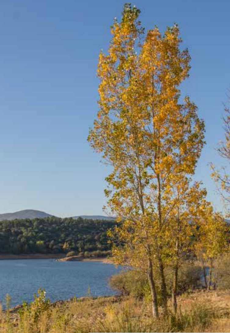
Embalse de Puentes Viejas, en otoño

Edición cofinanciada por la Comunidad de Madrid y el Ayuntamiento de Puentes Viejas. Depósito Legal: M-14514-2021. · Contenidos y elaboración: Javier Gómez Aoliz